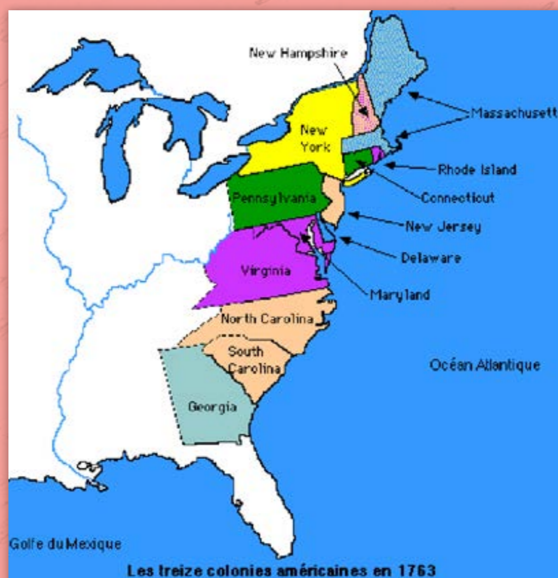
Carte des 13 colonies anglaises du Nord en 1763

L'élection présidentielle de 1789 et les deux mandats successifs de George Washington ont posé les fondements politiques et idéologiques du nouvel État. George Washington, qui a donné son nom à un État et à la capitale des États-Unis, a laissé son empreinte sur les institutions du pays. Considéré comme le père des États-Unis, sa mémoire est toujours célébrée et associée au 4 juillet, devenu jour de fête nationale aux États-Unis : l'Independence Day. Le billet de 1 dollar en cours aujourd'hui demeure à son effigie.